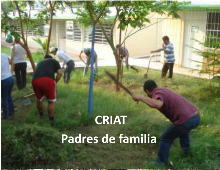
CRIAT Padres de familia